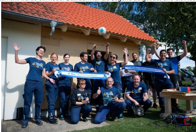
Bild: Beim FC Blau-Weiß Bellamont wurde ein neuer Ballraum für die Jugend aufgebaut und die Auswechselbänke des Vereins bekamen einen frischen Anstrich.

Alle Informationen zur Bewerbung und das Bewerbungsformular finden Sie unter www.enbw.com/macherbus