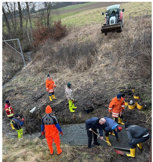
Reinigung des Rechens vor dem HWRB

Zum guten Abschluss der Versammlung hat die Gemeinde die Feuerwehrkameraden zu einem Vesper eingeladen.