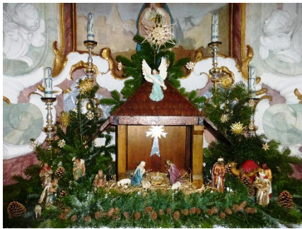
Krippe St. Cosmas und Damian in Unterwachingen