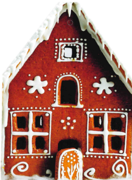
(Stiftung Marburger Medien)

Wie schön kann es sein, wenn man an Weihnachten nach Hause kommen darf? Vertraute(s) sehen. Traditionen leben. Familie treffen.