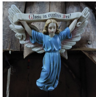
Krippengel in der Grundschule Christoph-von-Schmid-Schule, Oberstadion 2024