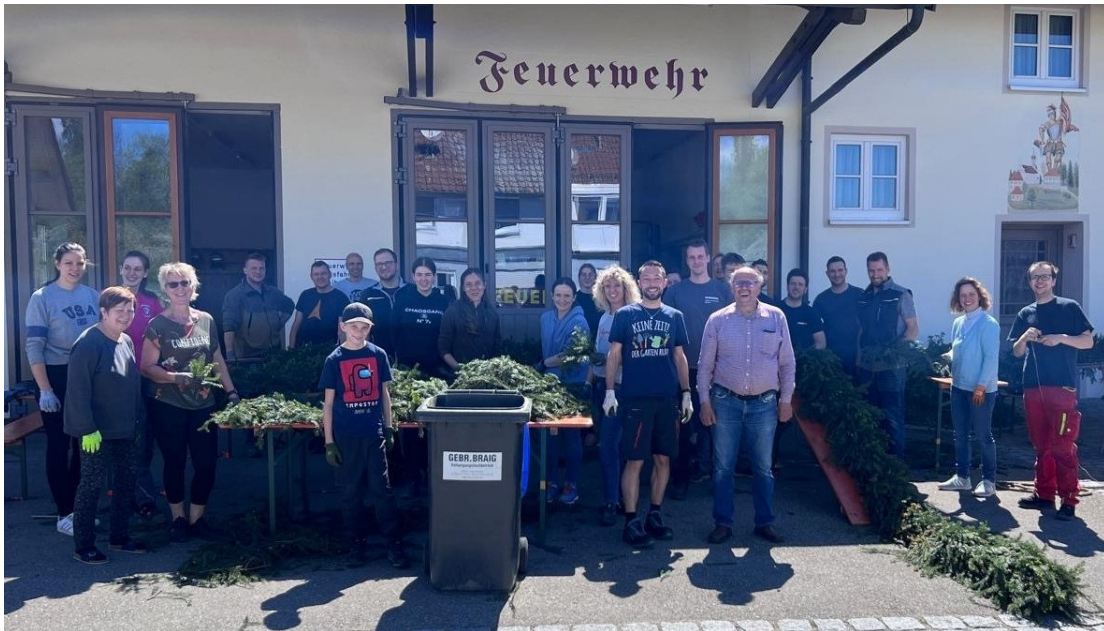
Vielen Dank für diese schöne und erfolgreiche Gemeinschaftsaktion.

„Viele Hände gaben ein schnelles Ende“. Nach ca. 3 Stunden waren die Girlanden und die Bäumchen gekranzt bzw. geschmückt. Alle beteiligten Personen, „Junge und Ältere“, hatten sichtlich Spaß an dieser Gemeinschaftsaktion. Die Gemeinde sorgte für ausreichend Getränke, sodass die Aktion mit einem gemütlichen Umtrunk erfolgreich beendet werden konnte. Am Dienstag, 30.04.2024, wurde der Maibaum durch die Freiw. Feuerwehr beim Sportplatz neben dem Rathaus, in der Dorfmitte, wie gewohnt aufgestellt.