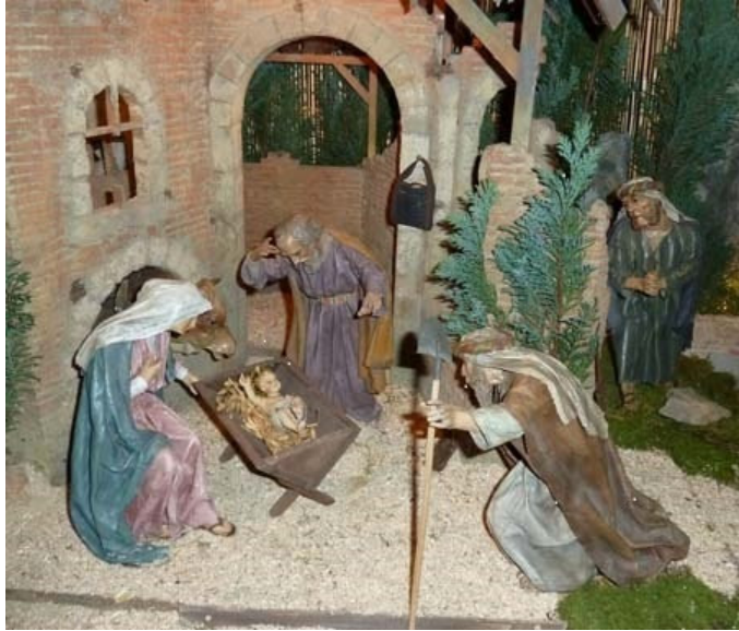
Krippe in der Pfarrkirche Oberstadion

Liebe Schwestern und Brüder in unserer Seelsorgeeinheit Donau-Winkel!